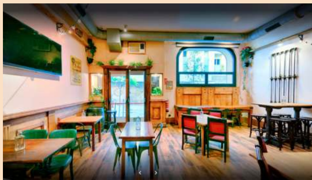
Sala Privada "Courtyard"

PULSA AQUÍ PARA HACER UN TOUR POR NUESTRO LOCAL