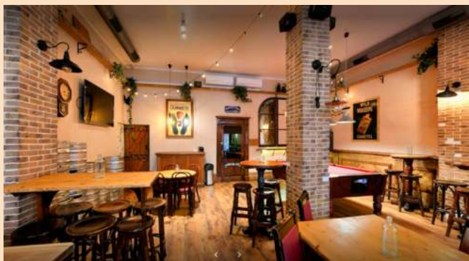
Sala Privada "Courtyard"